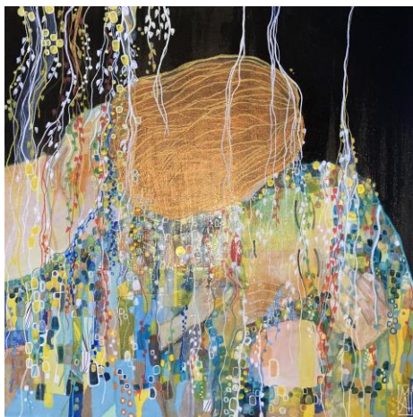
« L'Amoureuse »

Rendez-vous dans la galerie exposition d'artistes, accès par Le Monde des Automates : Place Jacques Faizant à Saint-Claude.